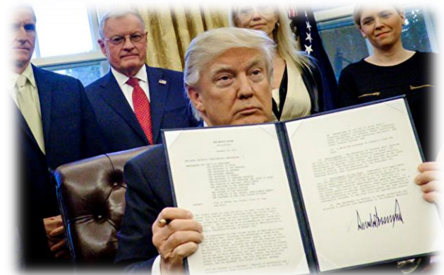
川普政府 21 日发布一份全球人权侵犯者和腐败者的制裁名单。图为川普于 1 月 28 日签署关于游说禁令和打击 IS 的行政命令。

【《全球马格尼茨基人权问责法案》】2016年圣诞节前夕，美国《全球马格尼茨基人权问责法案》经过国会批准和时任总统奥巴马签署后，正式生效。该法案旨在授权美国政府制裁全球违反人权者和贪腐者，主要制裁措施包括：取消领取美国签证的资格，撤销已有美国签证，冻结在美国境内的资产，禁止其资产在美国境内交易。具体执行机构是美国国务院下属的民主人权和劳工局。