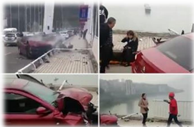
2018年10月28日重庆长江二桥发生严重事故，大巴冲破围栏坠江。

2018年, 15条鲜活的生命, 瞬间消逝了, 教训极其惨痛。重庆警方公布事故调查结果, 证实失事司机和一名女乘客在出事前一直在争执, 并相互殴打。可是, 两人背后的”戾气”哪里来的?