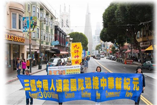
2018年4月7日，旧金山游行庆祝三亿人三退。

赶快到海外大纪元退党网站（或找法轮功学员）声明，退出您所加入过的党、团、队吧！即使您没入过党，只是小时候戴过红领巾、入过团，也是需要声明才能解除当时发下的毒誓的。因为誓言迟早要兑现的，它不会随着日久而自动消失。