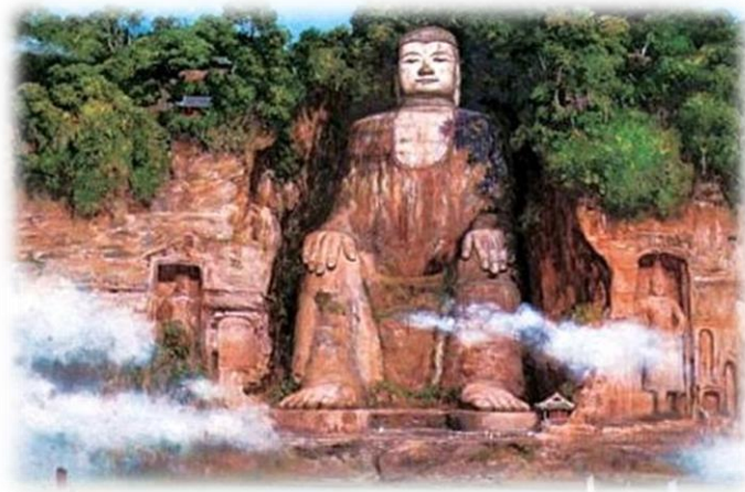
四川乐山大佛

举世闻名的四川乐山大佛，是世界上最大的石刻弥勒坐像。佛像高 71 米，端然正坐在大渡河、青衣江、岷江的合流处。因其依凌云山栖霞峰临江峭壁而凿就，被世人誉为“山是一尊佛，佛是一座山”。乐山大佛始建于唐开元元年(公元 713 年)，历时 90 余年方建成。历经 1800 年风雨依然屹立于天地之间，供世人敬仰膜拜，这是始建者海通法师及其继承者留给世人的宝贵财富。除了古代能工巧匠的智能令人称奇之外，古人对神佛的敬仰与坚信更是难能可贵，而大佛也多次显灵，护佑芸芸众生，警示着道德下滑的世人。