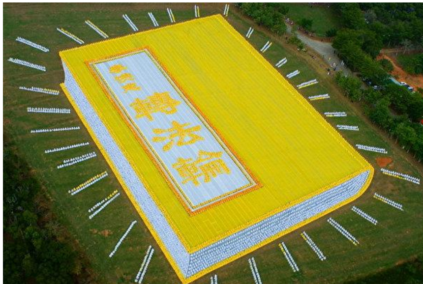
2010年，台湾部分法轮功学员6000人排出《转法轮》一书封面。