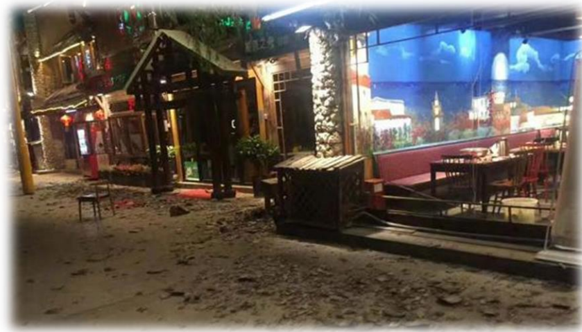
地震现场店家情况

去年8月8日21时19分，在四川阿坝州九寨沟县附近发生7.0级强震，当时著名九寨沟景区剧场正在上演《九寨沟千古情》大型歌舞剧，台下2000人观看。从现场传来的视频可见，顷刻间，灯光掉线，闪电大作，舞台和背景建筑物剧烈摇晃，一名男演员大喊“小心！地震了！地震~！！”然后拉起女演员狂奔，其他演员也都四散逃离。据悉，这个节目是九寨沟千古情其中的一部，以再现“5.12汶川大地震”场景为内容，题名为“大爱无疆”。